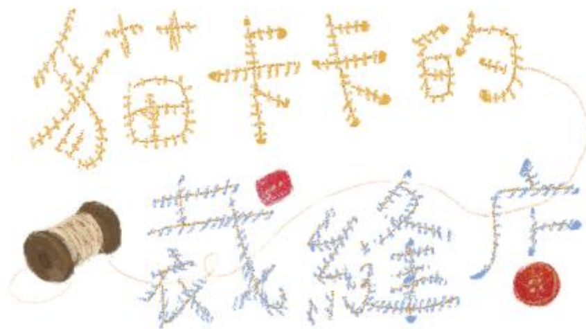
學習單設計 / 葉惠貞老師 (國立清華大學附設實驗小學)

讀完了三篇溫暖動人的童話故事，你是不是也被貓卡卡講義氣的個性、不計前嫌的心胸、樂於助人的好心腸所折服了呢？讓我們一起再重溫一下精彩的故事內容，做做看以下有趣的活動，請貓卡卡也為你做一件專屬的衣服吧！