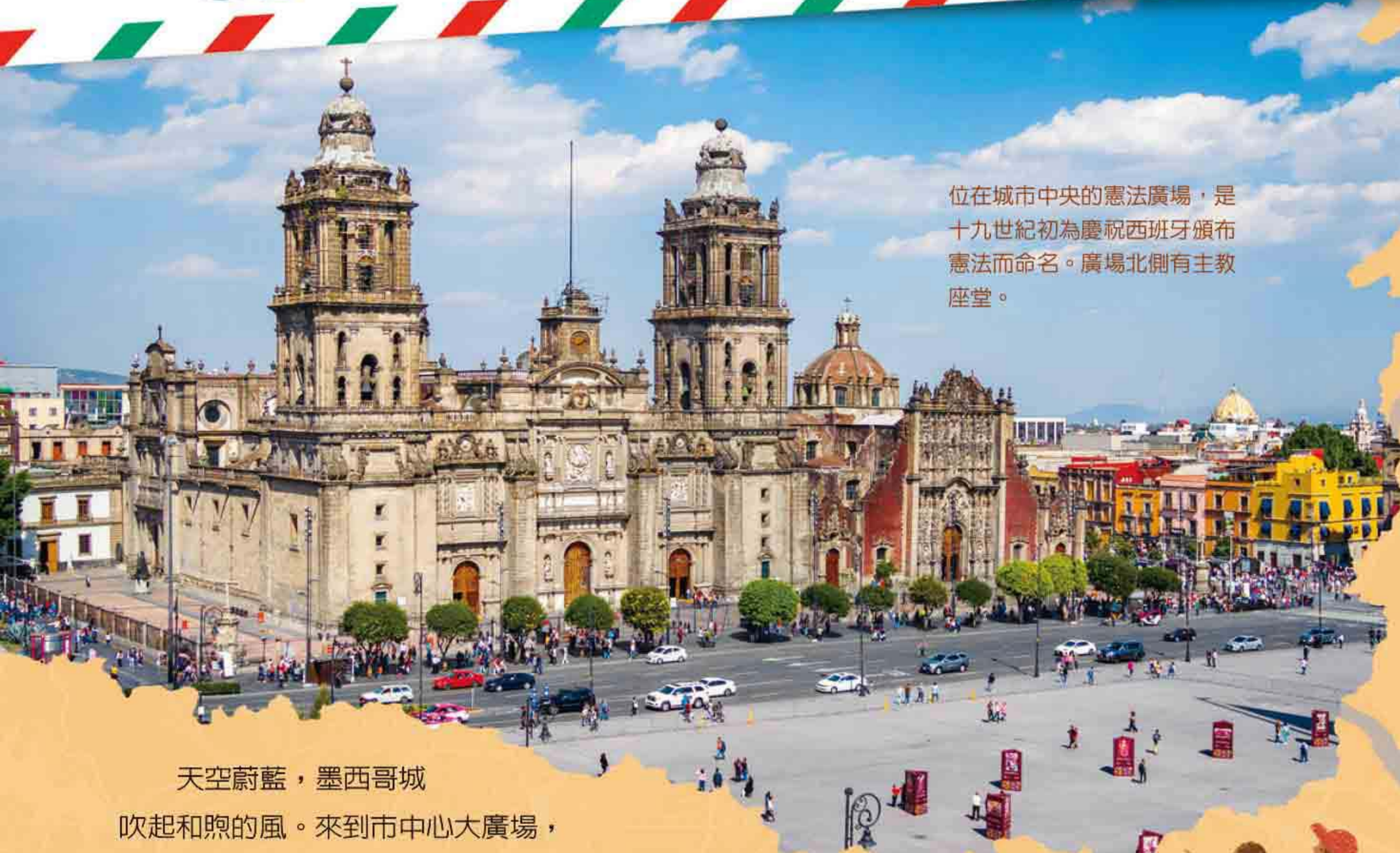
位於城市中央的憲法廣場，是十九世紀初為慶祝西班牙頒布憲法而命名。廣場北側有主教座堂。

撰文／鄧小非 繪圖・版面／Amann 企編／霏雅