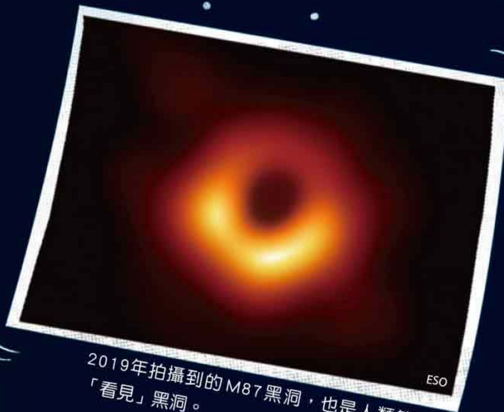
2019年拍攝到的M87黑洞，也是人類第一次「看見」黑洞。