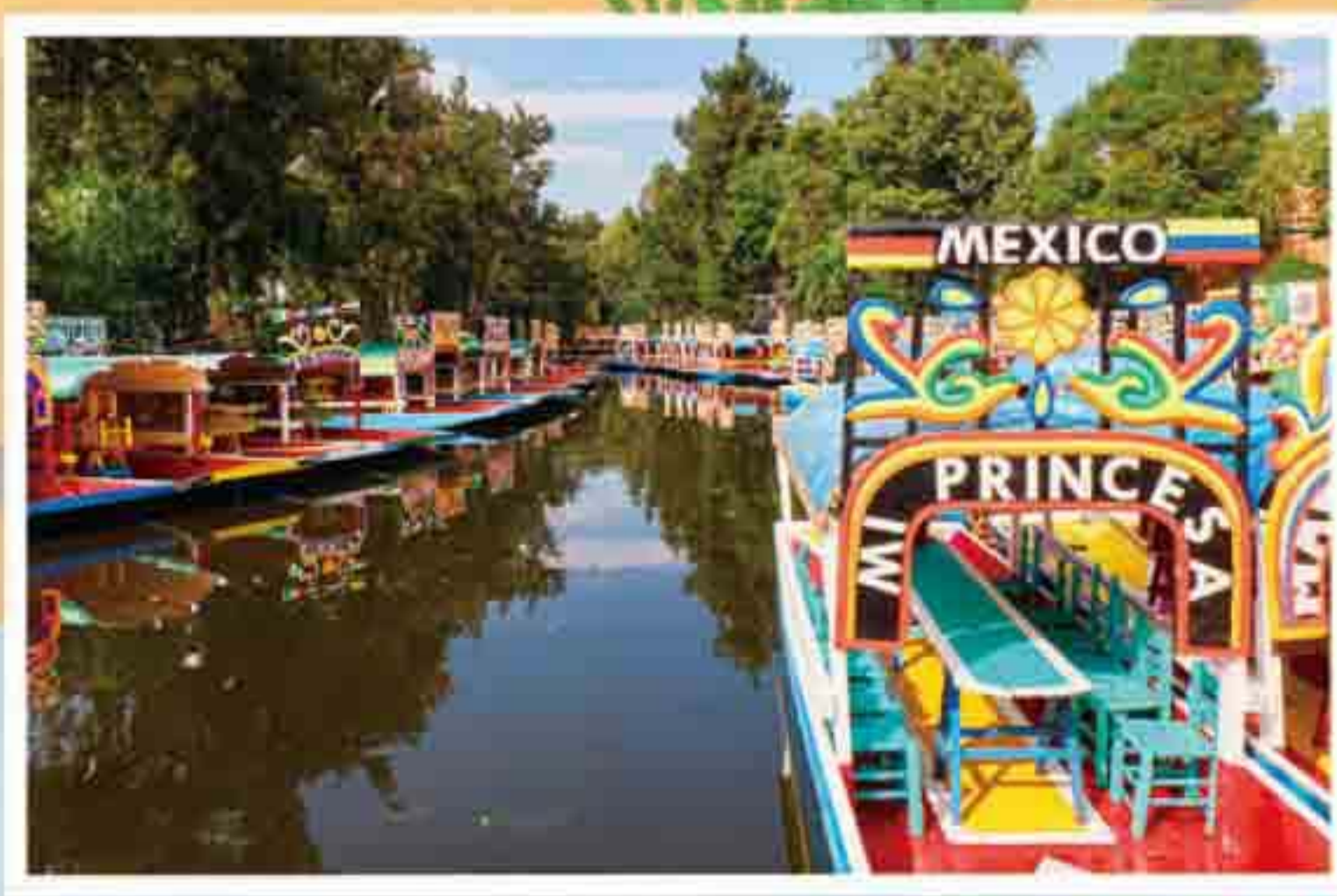
運河上絢麗的花船。

西班牙人不習慣與水共生，於是他們把運河填平成道路。為解決洪災又興建大型排水道，排乾湖水。於是，水域漸漸消失，陸地不停擴大。接著，一波波移民前來新天地，將歐洲城市「大廣場加棋盤街道」