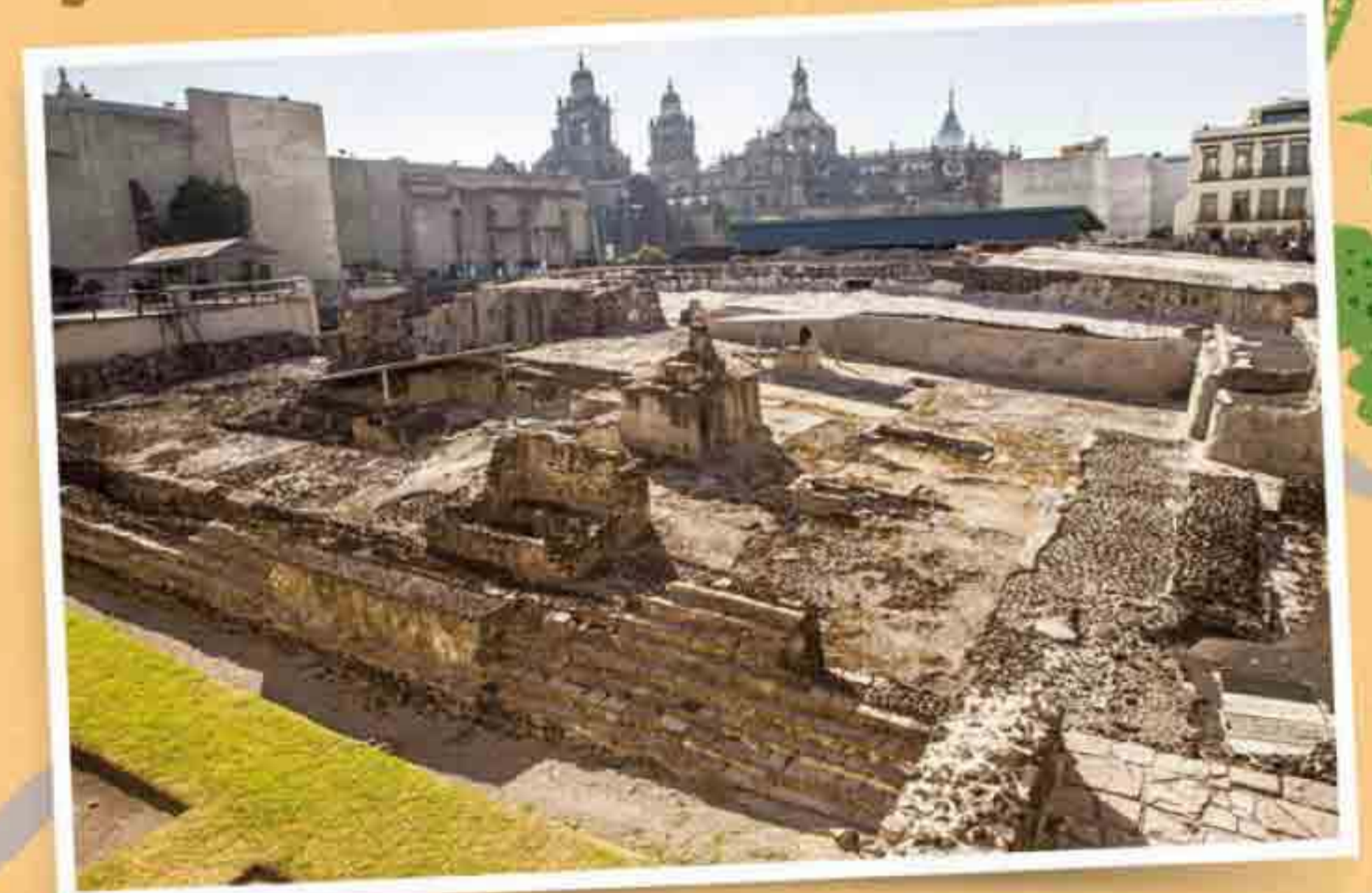
大神廟遺址，阿茲特克國王在此獻祭活人。現已成為博物館。

的設計，複製貼上。總督府、教堂、皇家大學、醫院，如雨後春筍，出現在各個角落；經過三百年，仍有許多屹立城中。