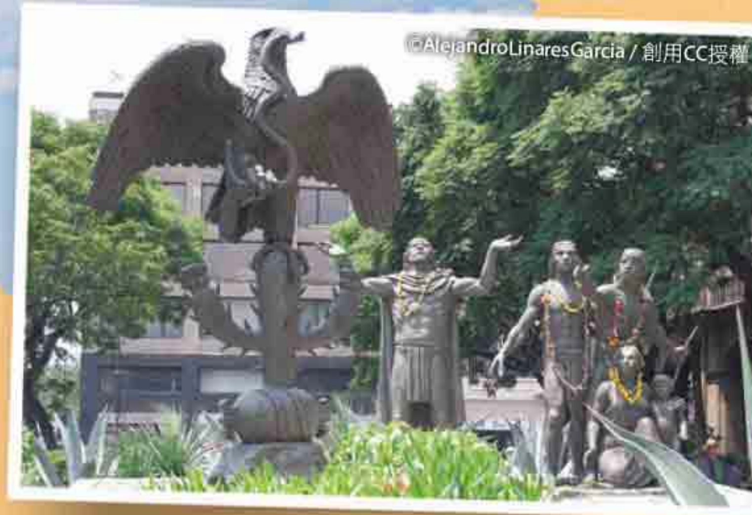
阿茲特克建城傳說的紀念雕塑，造型是雄鷹叼著蛇站在仙人掌上。