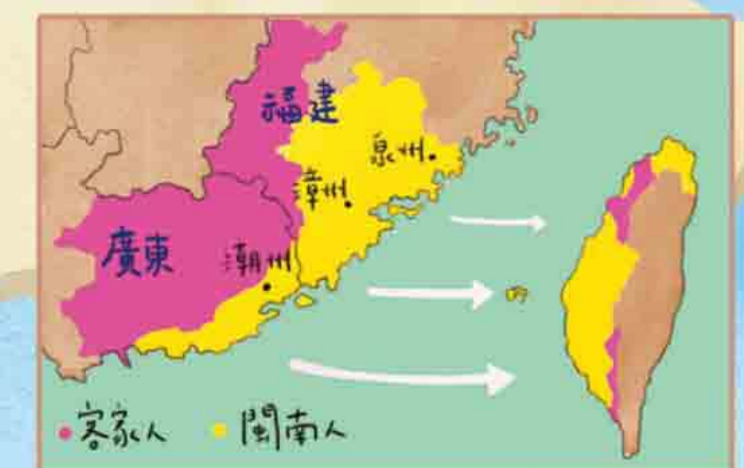
客家人渡海來臺後，多選在和原鄉一樣靠山的地方開墾。他們在山坡地開墾梯田，把這項技術引進臺灣。

搭公車、火車或捷運時，你有沒有注意過，除了中文、英文、閩南語，還有一種腔調婉轉的語言？沒錯，那就是——客家話。