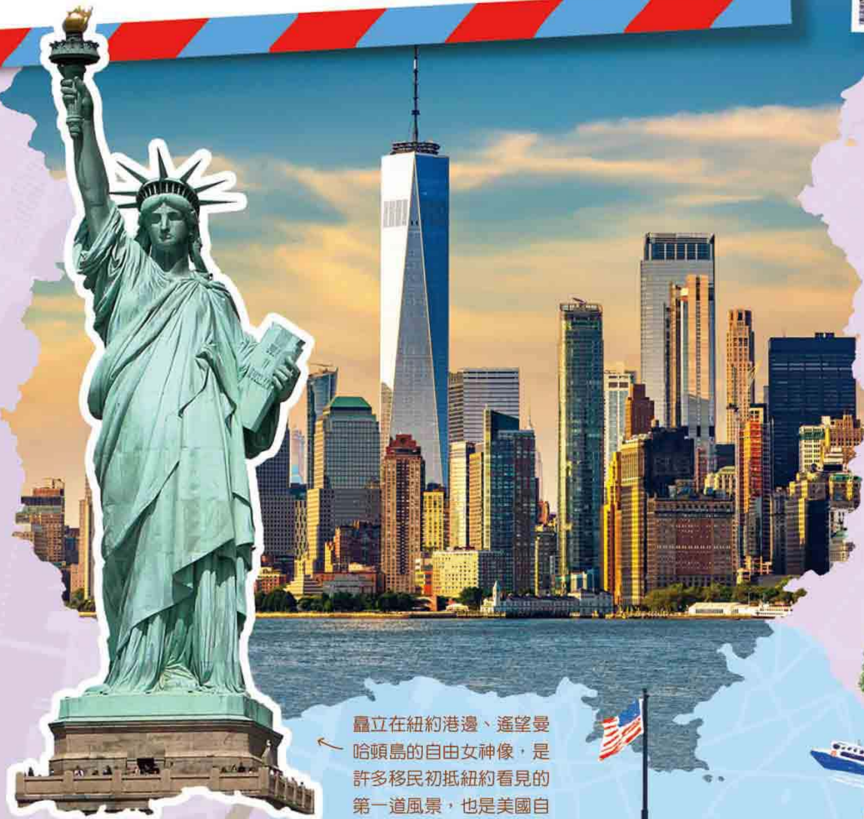
矗立在紐約港邊、遙望曼哈頓島的自由女神像，是許多移民初抵紐約看見的第一道風景，也是美國自由精神的象徵。

後來，人們又挖了運河（如：伊利運河），把水路接得更遠，甚至一路連到北美五大湖。等於在美國地圖上開出一條「水上高速公路」：貨物可以從內陸