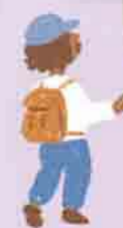
紐約的大都會博物館是世界四大博物館之一，每年吸引超過七百萬人次參觀。

現在想像你站在華爾街，抬頭是密密麻麻的高樓，車聲、人聲、腳步聲都很急。但三百多年前，這裡其實是一片森林和沼澤，河狸到處出沒。早先占領這裡的荷蘭人，看上的