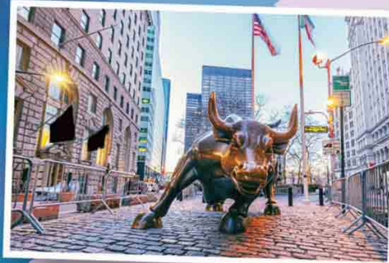
華爾街的著名打卡點「銅牛」，象徵美國金融市場的活力和衝勁。許多遊客會特地來摸摸銅牛，祈求財富和好運。

一路搭船到港口，再出海。於是紐約很快變成當時最重要的貨物集散地——東西到了這裡，就能被轉出去；想進美國的貨，也會先集中到這裡。就這樣，紐約成了全世界最熱鬧繁榮的都市，當中的「華爾街」一帶，簡直是全球經濟的大心臟，每跳動一下，都可能撼動全世界呢！