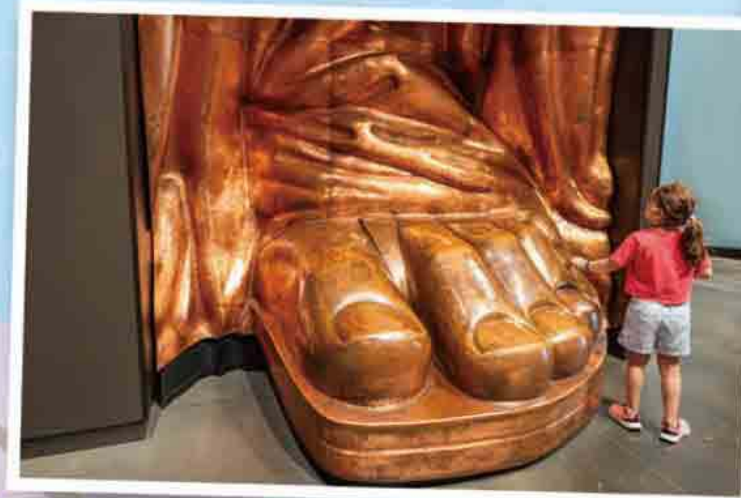
自由女神像底部是座博物館，館內展示了一隻自由女神的腳，呈現閃亮亮的紅銅色，是塑像剛造好時的顏色。

自由女神像在1886年亮相時，其實是閃亮的「紅銅色」。這座塑像是法國送給美國的獨立一百週年禮物，最外層包裹約兩枚硬幣厚的銅皮。因為矗立在海邊，長年經受風吹雨打與鹽分侵蝕，銅皮慢慢氧化，形成一層薄薄的「銅綠」。雖然顏色變了，這層銅綠反而像保護膜一樣，保護內部不再生鏽。