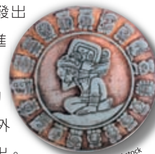
哈布曆的一個月只有20天，一年有18個月，再加上5天「凶日」，圖中外圈的19個圖案分別象徵18個月份與凶日。

F. 隕石撞地球： 巨大隕石襲擊地球，引起強烈地震、海嘯，以及全球性的黑暗與嚴寒。