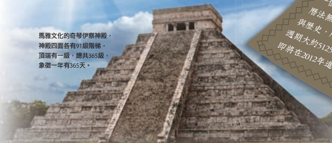
馬雅文化的奇琴伊察神殿，神殿四面各有91級階梯，頂端有一級，總共365級，象徵一年有365天。

古馬雅人是神機妙算的天文學家，制訂了各種精準的曆法。在日常生活中，他們通常使用以365天為週期的哈布曆，以及以52個哈布曆週期為一個循環的循環曆；但以上的曆法無法記錄年代久遠的神話與歷史，所以古馬雅人又發明了週期大約5125年的長紀曆，而且即將在2012年進入下一個週期。