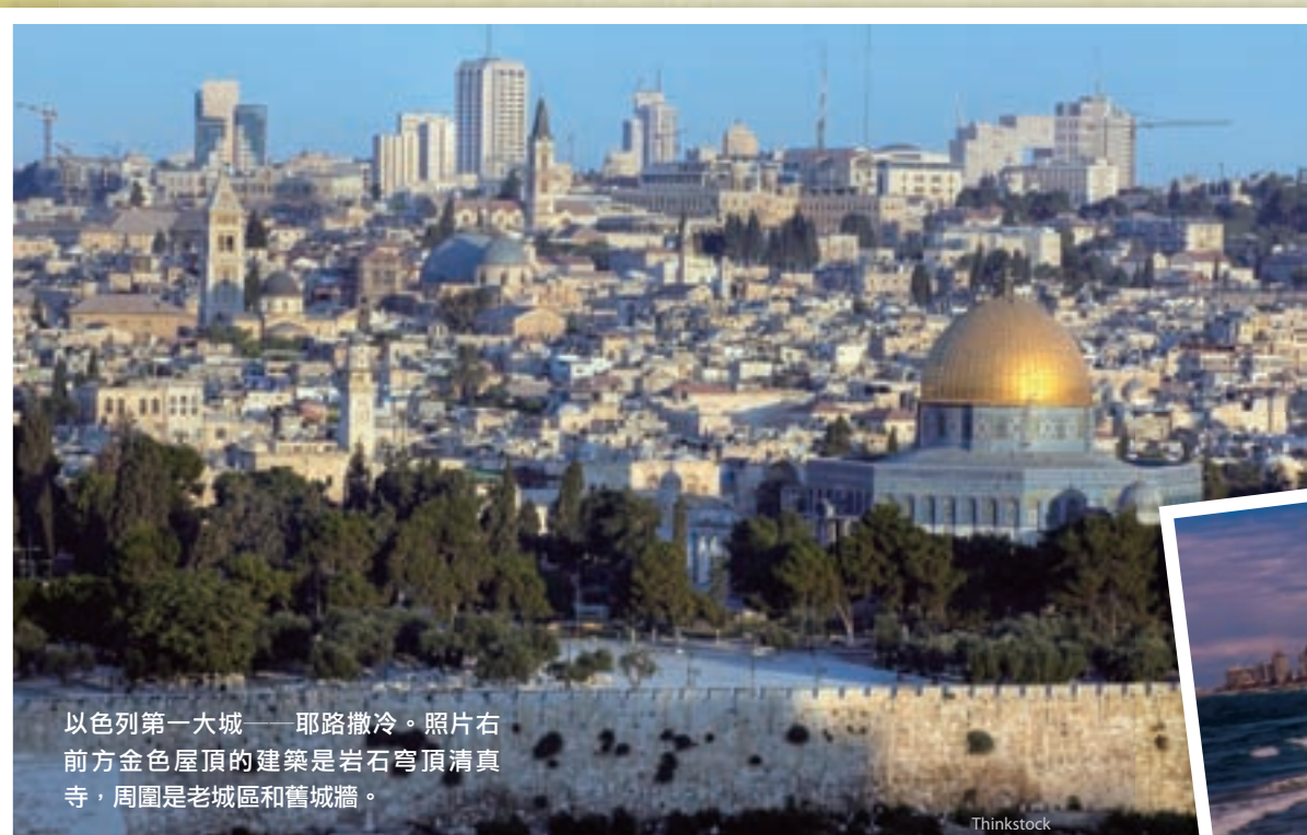
以色列第一大城——耶路撒冷。照片右前方金色屋頂的建築是岩石穹頂清真寺，周圍是老城區和舊城牆。

如今，這三大宗教建築物並存於一平方公里大的土地上，相去不遠。然而，在不同信徒間，那無形的距離卻無比遙遠。