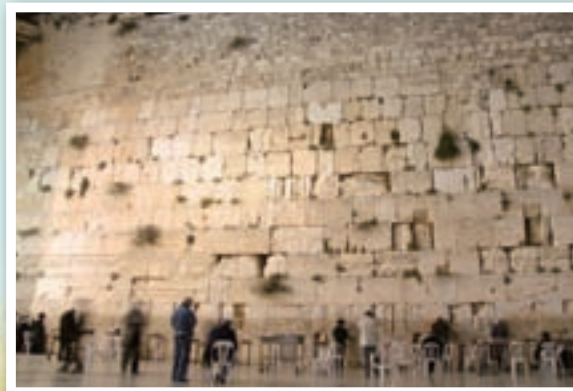
西牆和耶路撒冷，都是世界文化遺產。