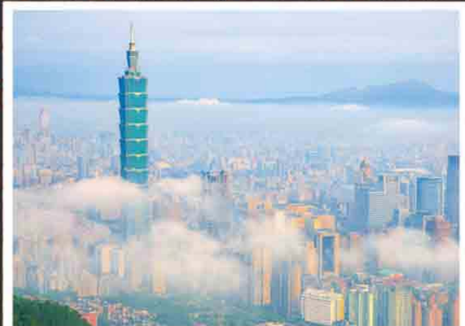
春天是濃霧最容易出現的季節。

春天暖空氣變多，和還沒離開臺灣的冷空氣相碰，互相推擠，讓天氣變得不穩定，今天冷、明天暖；上午放晴、下午下雨，令人捉摸不定。