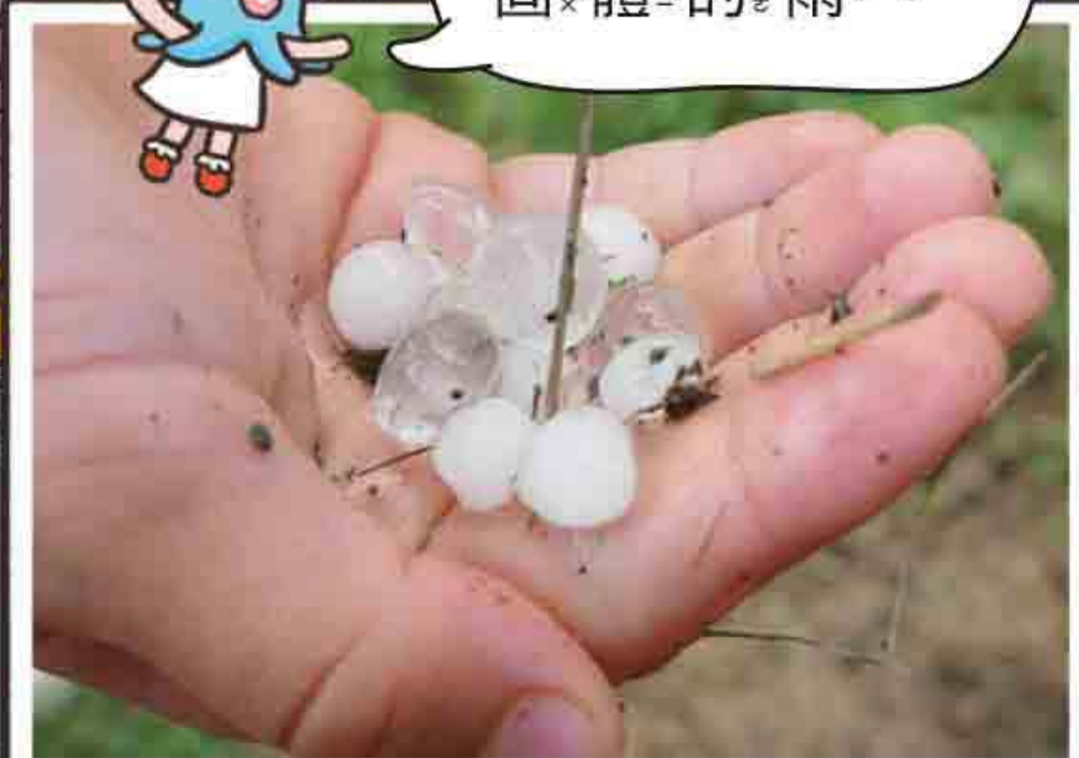
春天的大雷雨，有時也會跟著下起冰雹。